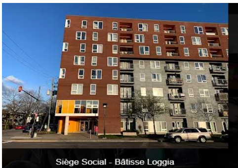
Siège Social - Bâtisse Loggia