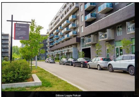
Bâtisse Loggia Polcan